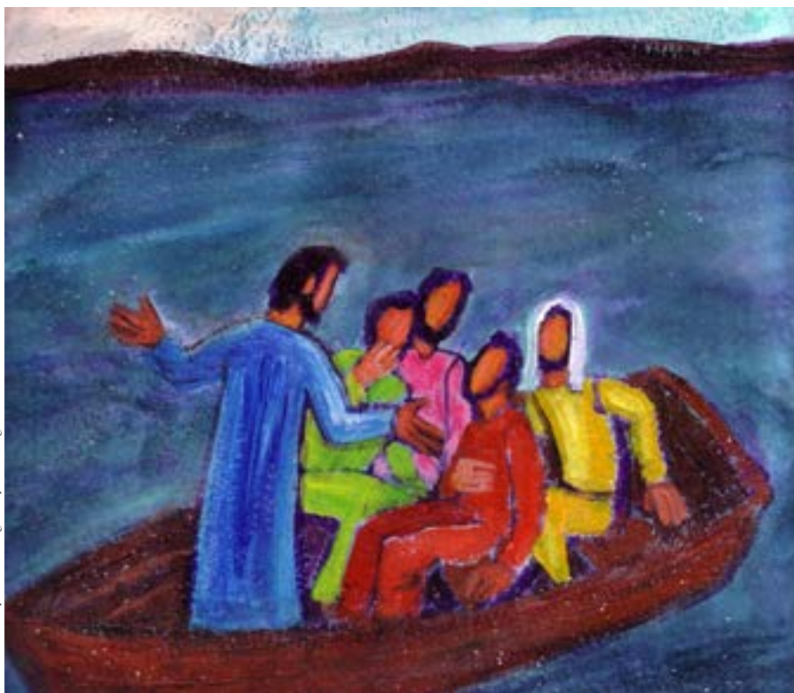
Jésus et ses disciples en barque.