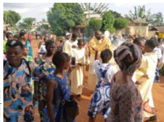
Procession du Christ Roi.

Avec du recul et vivant une nouvelle expérience pastorale, je comprends que ces six dernières années de mission fidei donum (*) ont été nécessaires pour en acquérir une nouvelle dimension. J'ai quitté une Église jeune avec ses réalités pour une autre chargée d'histoire avec ses réalités aussi. La boucle me semble bouclée avec