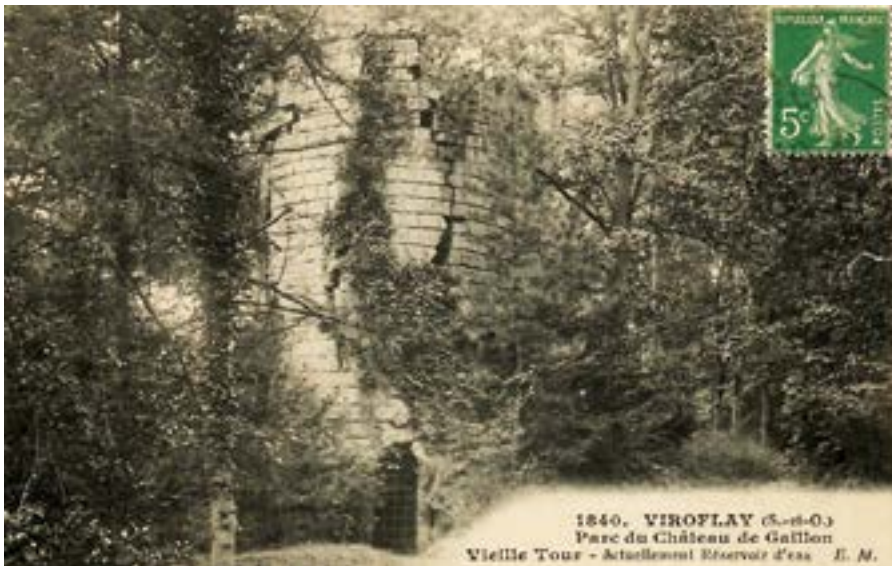
Carte postale ancienne datant de 1910.