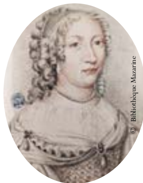
La belle chancelière Élisabeth Turpin, femme de Michel Le Tellier

Une carte postale de 1910 présente une tour « ancienne », située à l'emplacement de la maison Gaillon, datant du XVII e . Toutefois, sur un plan de 1820, la maison Gaillon a totalement disparu et l'histo-