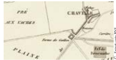
Plan AD Noël 1832.

rien Henri Lacoste nous confirme qu'un nouveau château Gaillon la remplaça au XIX e siècle. Quant à la tour Gaillon, aujourd'hui disparue, l'origine Seigneuriale paraît peu probable.