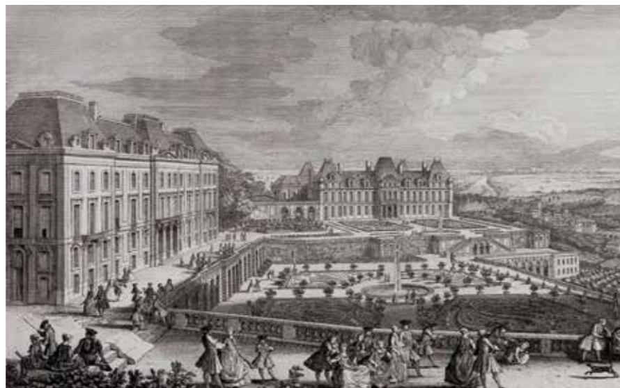
Meudon: à gauche le Château neuf et au fond le vieux château.

Le château de Meudon agrandi et augmenté du Château neuf est, au début du XVIII e siècle, un véritable palais. Lorsque le Grand Dauphin y séjourne, avec ses très nombreux courtisans, la