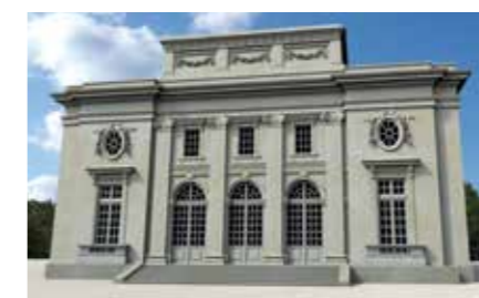
Façade du château du comte et de la comtesse de Tessé, vers 1770.