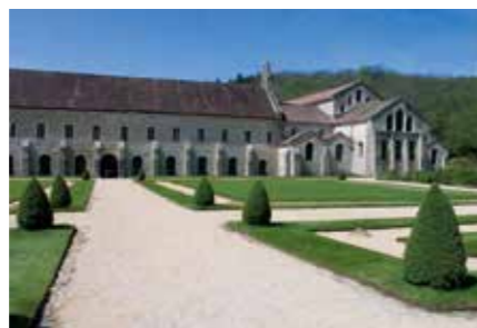
L'abbaye de Fontenay.

près de Saumur, avec les tombeaux d'Aliénor d'Aquitaine et de Richard Cœur de Lion, le Thoronet, au cœur de la Provence verte, inscrite au patrimoine mondial de l'humanité par l'Unesco. Pour des sites d'un intérêt architectural certain mais qui sont en plus illumi-