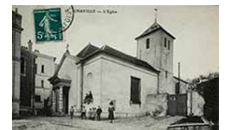
L'église Notre-Dame de Chaville, rue de la Mare Adam, détruite en 1969.