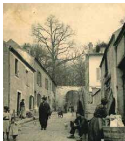
La porte de la Sablière, aujourd'hui au bout de la rue de la Mare Adam à Chaville.

Viroflay était hors les murs. Au bout des actuelles rues Le Tellier et Nicolas-Niquet, on a encore un témoignage de l'ambiance que le mur du Parc pouvait créer au village. L'entrée quotidienne n'étant normalement nécessaire que pour les paysans ayant des terres à l'intérieur, elle ne se faisait que par une quinzaine de portes très espacées: porte de la Sablière, pour le petit village de Chaville, porte de Viroflay à l'actuelle caserne de pompiers, Neuve porte près de l'actuelle piscine, et porte des Bertissettes près des tennis; portes