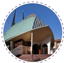
NOTRE-DAME DU CHÊNE

La paroisse Notre-Dame du Chêne vous accueille au cœur de Viroflay dans ses deux églises et à la maison paroissiale.