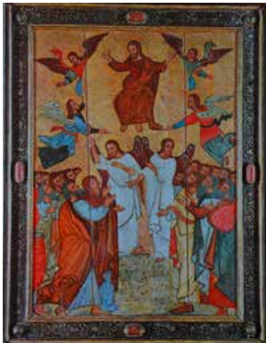
Ascension, école biélorusse, musée national des Beaux-arts de Biélorussie, XVII e siècle.

Mais je suis plus interpellé par ces mots : « il se sépara d'eux ». La fête de l'Ascension, c'est la fête de notre émancipation. Jésus est venu partager notre humanité, il a formé un groupe de disciples, dont certains (les Apôtres) seront appelés