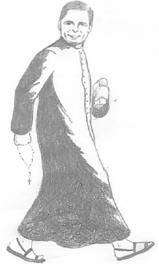
Le curé en été.