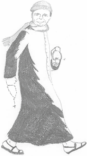
Le curé en hiver.