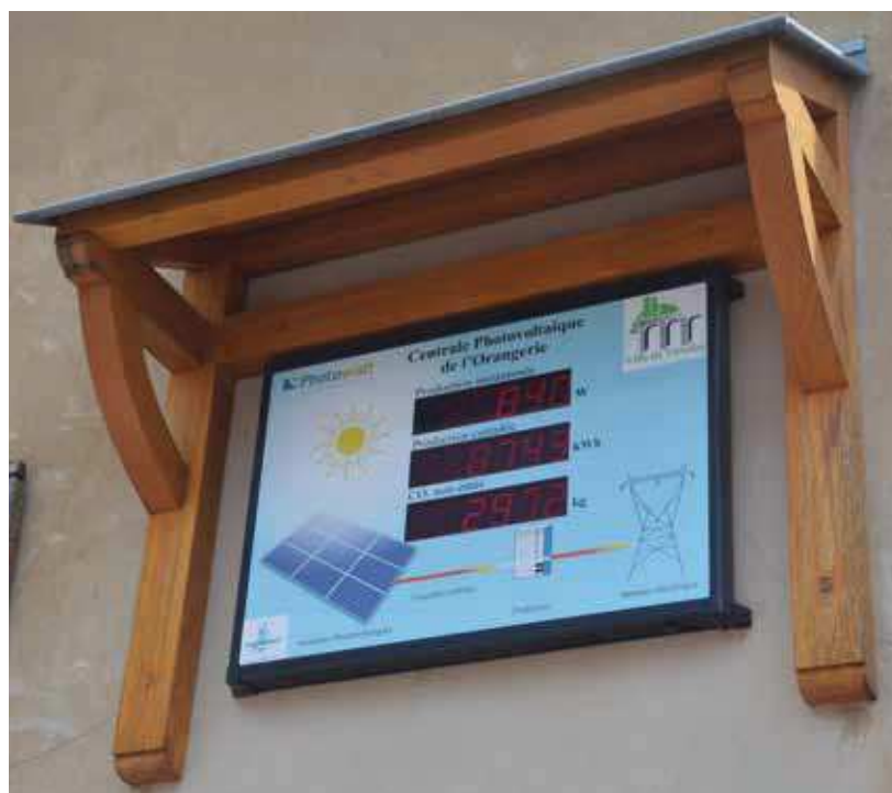
« Vers la transition énergétique » (Panneau de contrôle d'une installation photovoltaïque individuelle).

Une bonne occasion pour faire le point sur un sujet d'actualité qui nous concerne à travers nos modes de consommation.