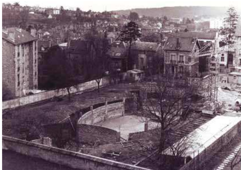
Fondations de l'église Notre-Dame-du-Chêne, en janvier 1962.

Fin juin 2016: journée et messe d'action de grâce