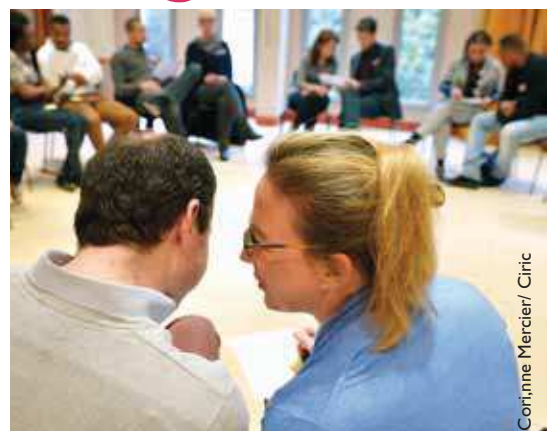
15 mars 2015 : Groupe de fiancés préparant leur mariage avec un Centre de préparation au mariage (CPM).

- Le sacrement engageant Dieu... il ne peut être dissous, Dieu restant toujours fidèle. L'Église ne juge pas ceux qui pourraient tomber, ou